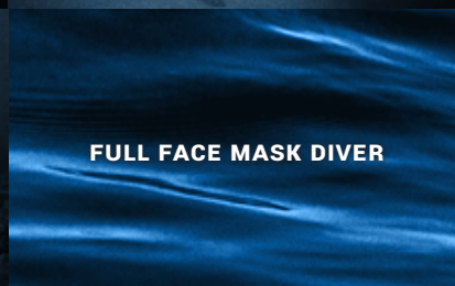
FULL FACE MASK DIVER