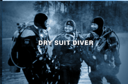
DRY SUIT DIVER