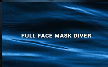
FULL FACE MASK DIVER