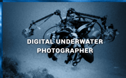
DIGITAL UNDERWATER PHOTOGRAPHER