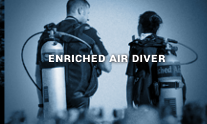
ENRICHED AIR DIVER