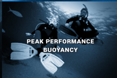
PEAK PERFORMANCE BUOYANCY